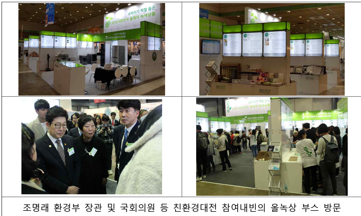
조명래 환경부 장관 및 국회의원 등 친환경대전 참여내빈의 올녹상 부스 방문